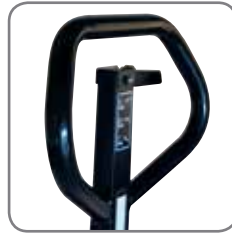
Ergonomisch handvat verzekert een relaxte grip. Kan voorzien worden van naam/afdeling.