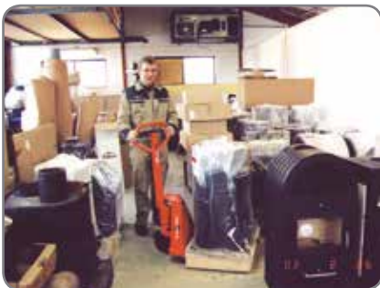
Gemakkelijk werken in gelijk welke enge ruimte verzekerd.