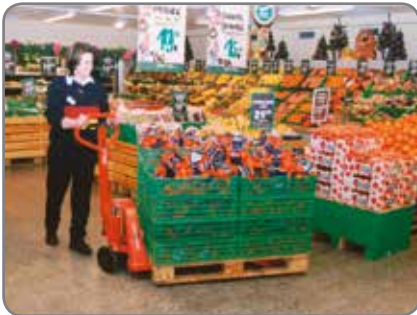
Aanpasbare vorkhoogte – geen problemen met lage en versleten paletten.

Roestvrij staal en explosievrije paletwagens eveneens verkrijgbaar.