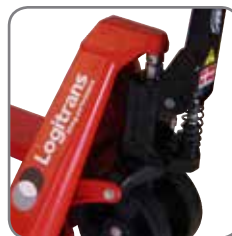
Permanente Quick Lift.