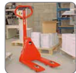
Verkrijgbaar in verschillende vorklengtes.

Wij bieden eveneens op maat gemaakte oplossingen. Vraag meer informatie, of bezoek www.logitrans.com