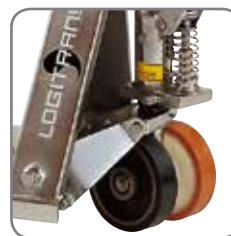
Verskillende wieltypes volgens nood van gebruiker.