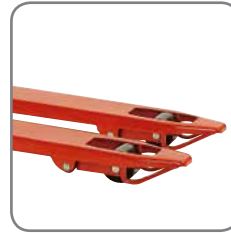
De beugels aan de vorkuiteinden garanderen een gemakkelijk inrijden en uitrijden van paletten.